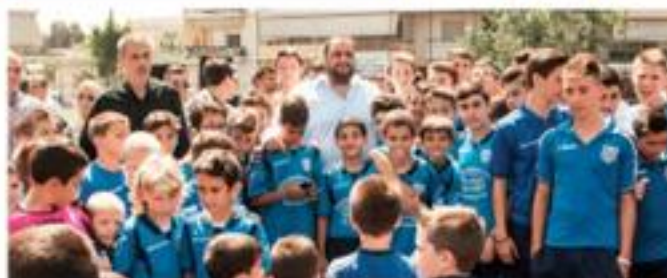
Δημοτικό Γήπεδο Καμινίων