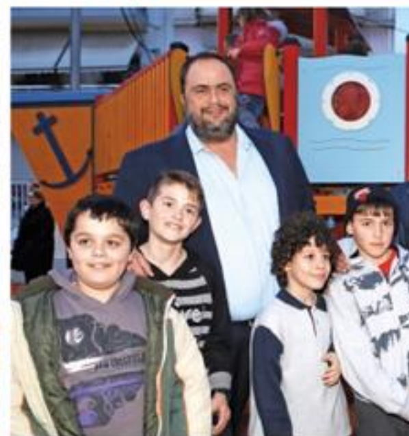
Πλατεία Θεμιστοκλή - παιδική χαρά, Μανιάτικα