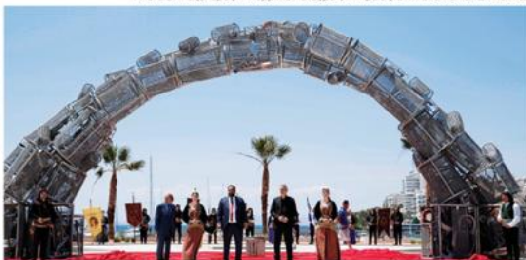
Πλατεία Αλεξάνδρας - «Πυρρίσιο Πέταγμα», Μνημείο για τη Γενοκτονία των Ποντίων

Στις 26 Μαΐου σας ζητώ να ανανεώσουμε το συμβόλαιο καρδιάς που υπογράψαμε το 2014. Επαναφέραμε την αισιοδοξία και το χαμόγελο στις Πειραιώτισσες και στους Πειραιώτες. Τώρα, ήρθε η ώρα να μας εμπιστευθείτε ξανά, προκειμένου να ολοκληρώσουμε το έργο μας και να φτιάξουμε μια πόλη για την οποία θα είμαστε περήφανοι, όπως αρμόζει στην ιστορία και στις δυνατότητές μας.