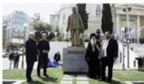
Μνημείο Αφανούς Ναυτικού

Κερδίσαμε το στοίχημα για τη δημιουργία χώρων άθλησης και παιδότοπων σε κάθε γειτονιά